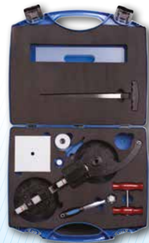
PANTHER CUT PRO Réf. : PPP-WST100 ■ Outil de découpe par l'intérieur ■ Tous types de vitrages