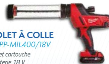
PISTOLET À COLLE Réf. : PPP-MIL400/18V ■ Poche et cartouche ■ sur batterie 18 V