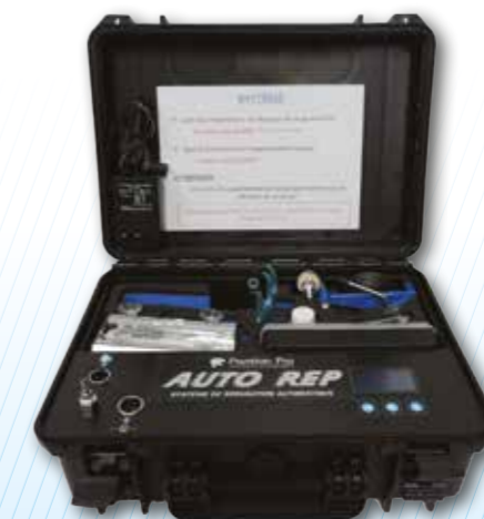
SYSTÈME DE RÉPARATION D'IMPACTS Réf. : PPP-WST99N1-MINI ■ Semi-automatique ■ Autonome air / électricité